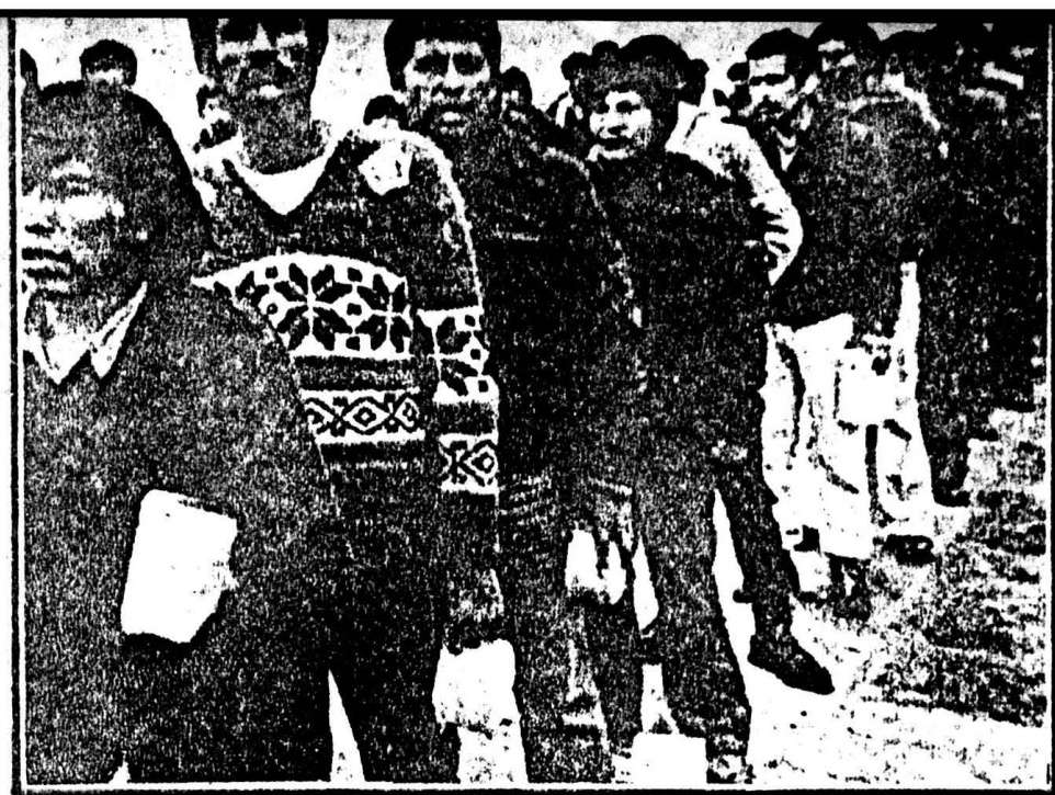
Los jóvenes militantes de SL tienen una acerada formación político-militar. En la foto, detenidos en El Frontón.

nación de la etapa democrática de la revolución... La comprensión de la tercera etapa es clave para que este pueblo nuestro avance. Esta tercera etapa, que implica. Implica que la revolución, el pueblo con las manos armadas comienza a tomar el poder y