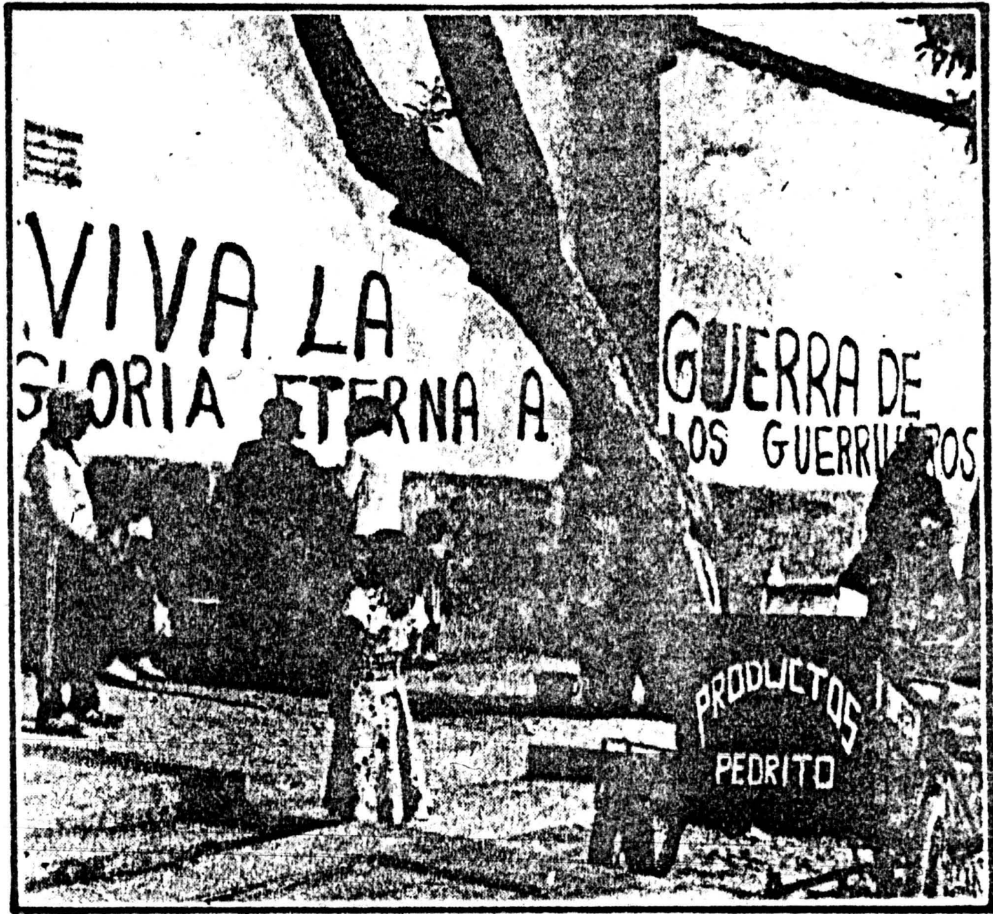
Las consignas senderistas resumen el "pensamiento Gorzalo".

r- s- e- s n l a n e- o o- al, s é- a- le- r- is a r- le- lo sa la t- n- a- n- iz ra as s, n- a er le in ti- o- r- ra ro a, te lo o- y