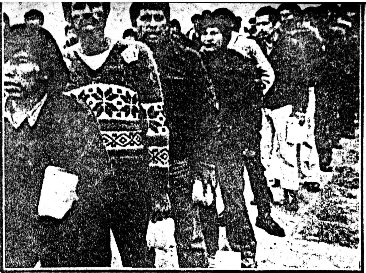
Los jóvenes militantes de SL tienen una acerada formación político-militar. En la foto, detenidos en El Frontón.